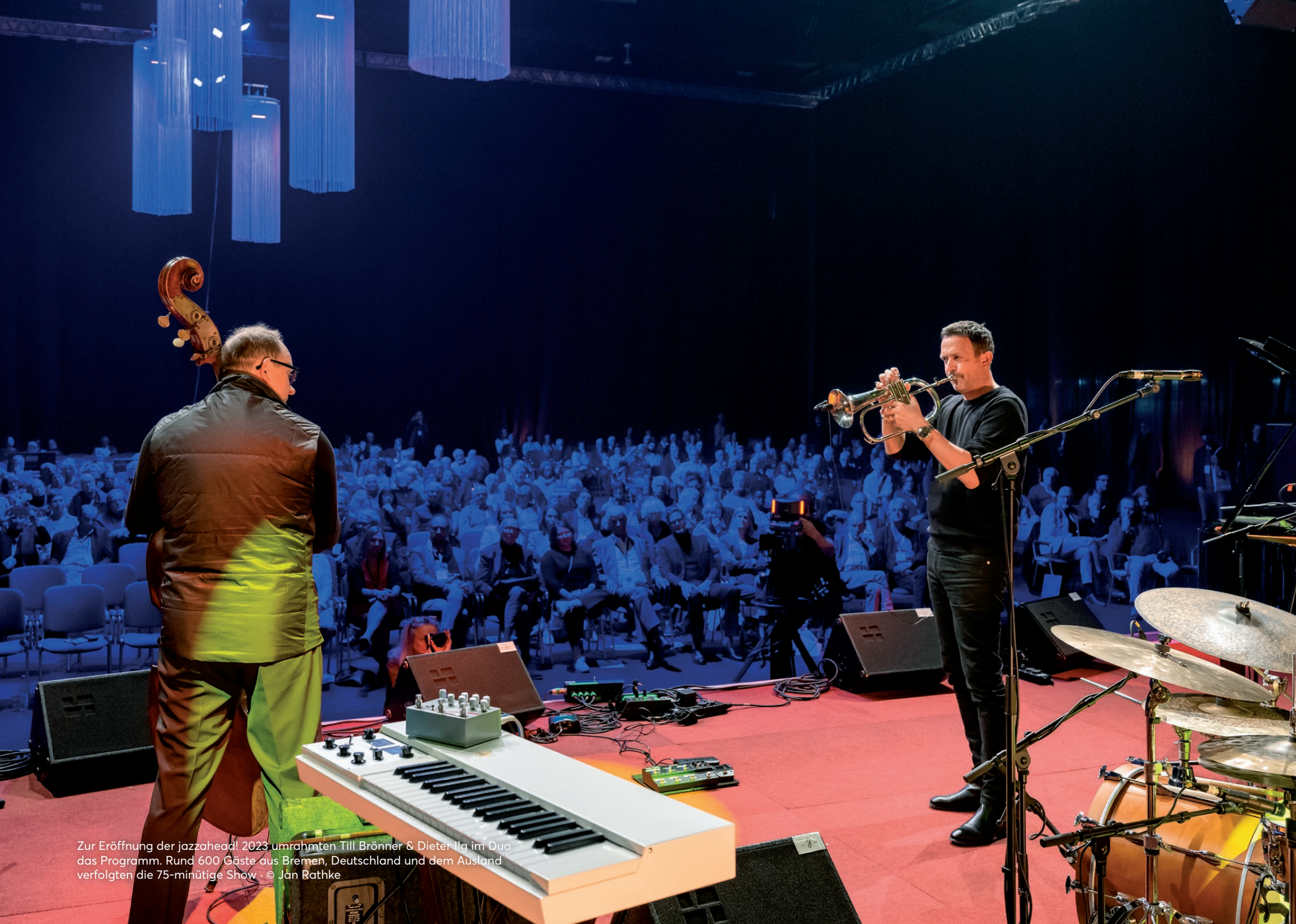
Zur Eröffnung der jazzahead! 2023 umrahmten Till Brönner & Dieter Ilg im Duo das Programm. Rund 600 Gäste aus Bremen, Deutschland und dem Ausland verfolgten die 75-minütige Show