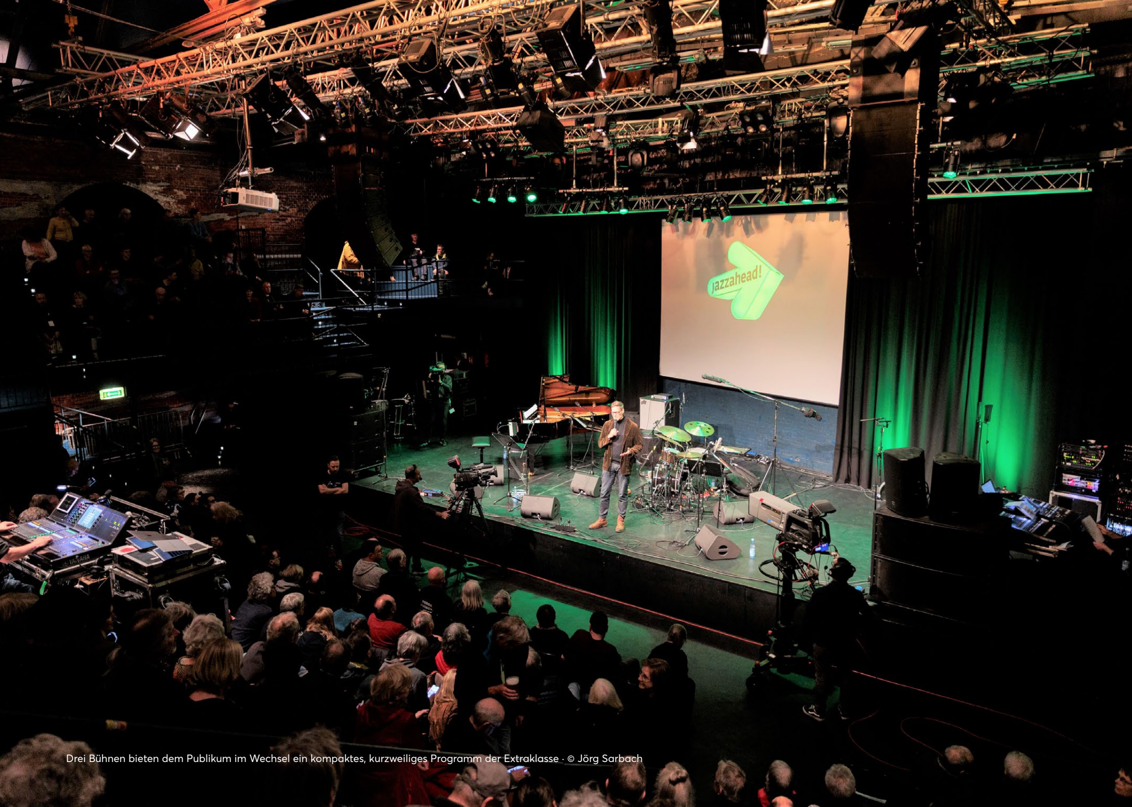
Drei Bühnen bieten dem Publikum im Wechsel ein kompaktes, kurzweiliges Programm der Extraklasse